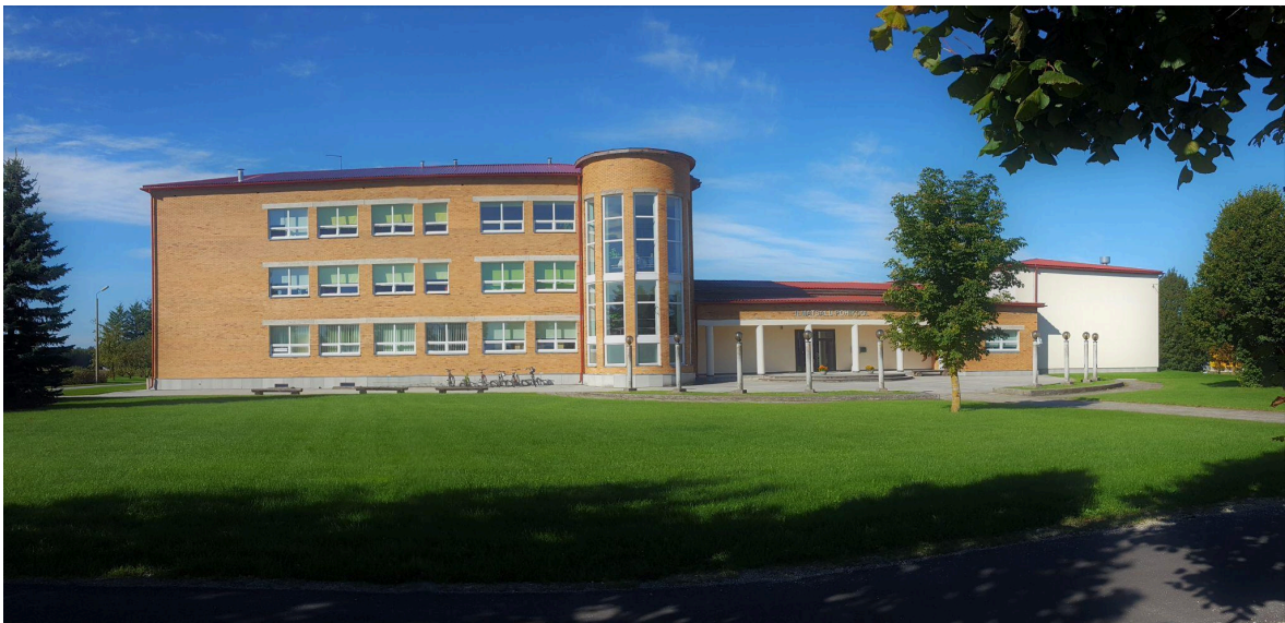
Ilmatsalu Põhikool.